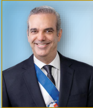
LUIS RODOLFO ABINADER CORONA

Presidente Constitucional de la República Dominicana