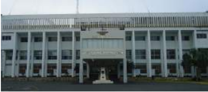
Figura No. 1 Edificio central del INSUDE.